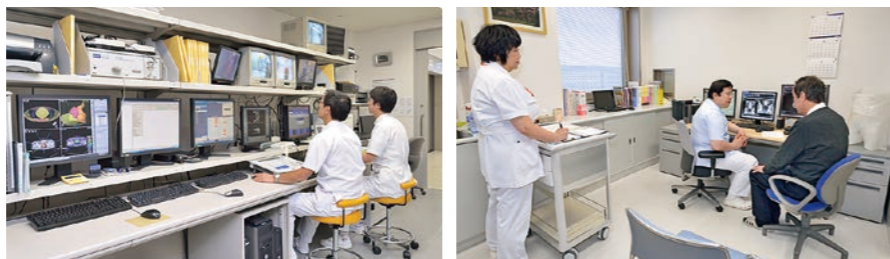
定位放射線がん治療システム「ノバリス」